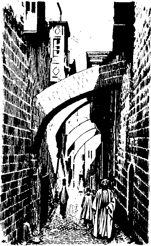
Daleng sĕmbua su soan Yerusalem (5:1)

9 Tangu su tempo ene lai tau e napia. I sie nĕhengke e tĕpihe ku bou e rimaleng.