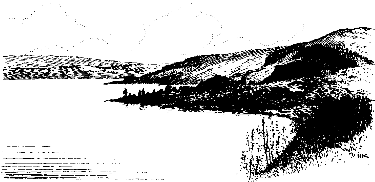
Danong Galilea (7:9)

6 ”Bēdangbe waline tempone si Sia,” unguēngu Mawu Yesus si sire, ”arawe waugu i kamene, sētinia mang botonge. 7 Dunia ini e tawe mariadi mēbinsi i kamene. Arawe Ia e mang ipēbēbinsi dunia, ualingu Ia mēngkate hanesē mēbēbera su dunia e u kakakoꝝ e kai ralakisē. 8 Dako e i kamene hala kakoꝝ soꝛong saꝛimbang ene. Ia e tawe tamai u reng baꝛine tempoKu.” 9 Kerene pinēhengetang u Mawu Yesus su manga anaꝛu sēmbau e, ku i Sie natanaꝛu su Galilea.