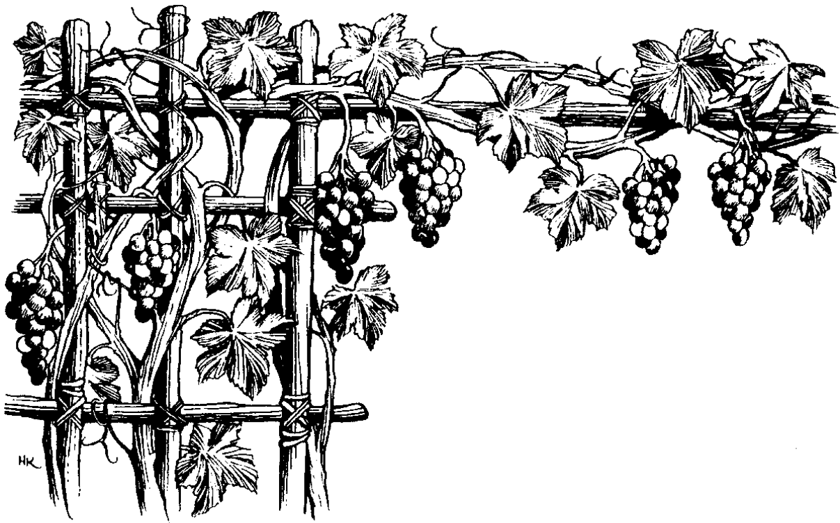
Manga lelangu kalung angorë (15:5)

reu i kamene k̄atatan̄a s̄embau dingangKu, mase waweraKu e mātatan̄abe surālungu naung i kamene, p̄gause si Amang walāewe apa ghausang i kamene mang ḡelirang. 8 Kereu i kamene m̄emp̄bua mālawo, i AmangKu e iapakawantuḡe, dingangu uālingu ene i kamene mambeng kah̄ngang makōa murit̄eKu. 9 Kerewe i Amang kūk̄endagu Ia ute kerene lai Ia kum̄endagi kamene. K̄engkatan̄ako i kamene s̄entinīa m̄emp̄b̄eb̄iah̄e kere taumata Taku ik̄ek̄endaḡe. 10 Kereu i kamene m̄ed̄endālengben