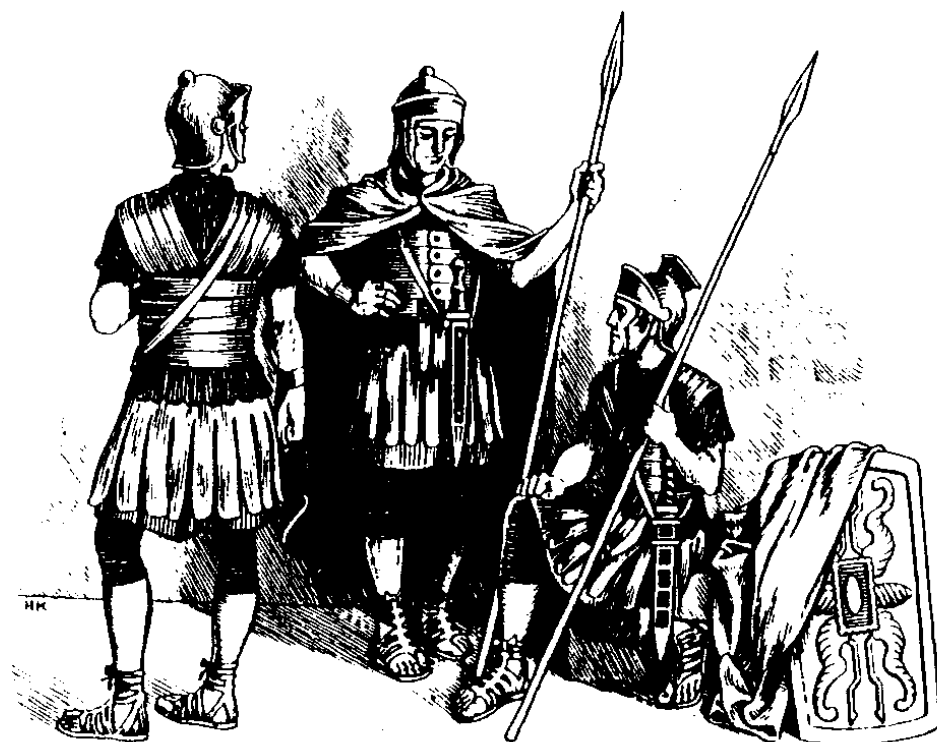
Manga soldadong Roma (19:2)

Mawu Yesus e tawe simimbang. 10 Tangu i Pilatus nēbera kapia, "Kai madiri i Kau mēbisa-ra ringanku? Kasingkako iā kai kawasa mēliwir'i Kau ringangu kawasa mēnguruis'i Kau."