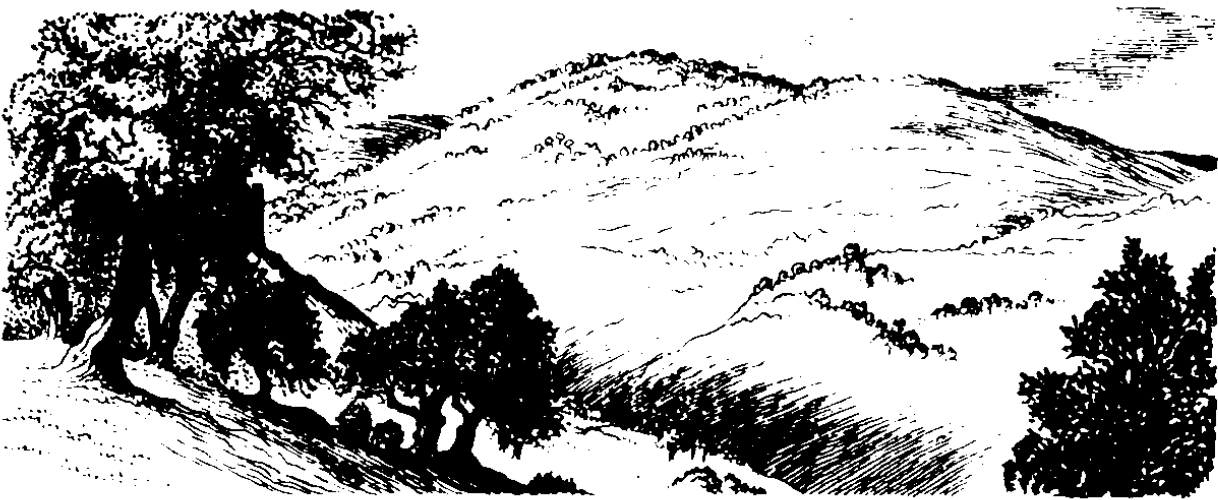
Bongkon Zaitun (8:1)

Mawu Yesus nĕpĕtie ku nĕbera su tau wawine ene, "Suapae i sire kĕbi e? Tawĕu nĕhukung si kau e?"